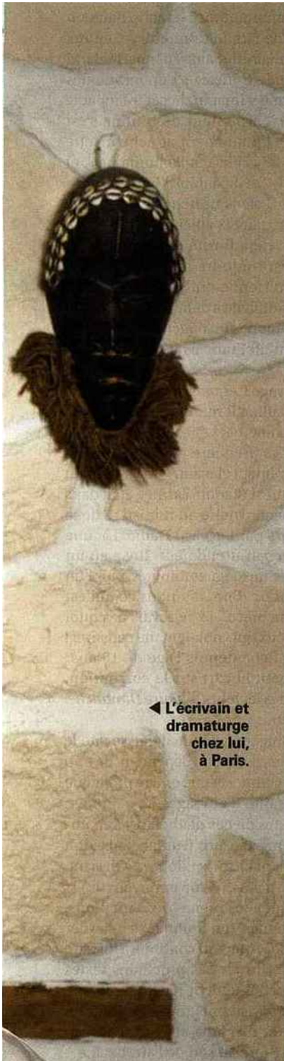
◀ L'écrivain et dramaturge chez lui, à Paris.

L'auteur d'origine ivoirienne vient de publier Nouvel An chinois , roman critique sur le repli identitaire français dans lequel il manie la langue comme un jazzman son instrument.