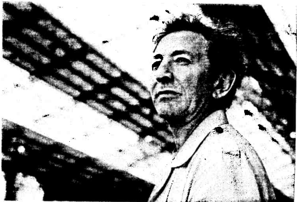
Jean-Marie Blas de Roblès : l'érudition au service du feuilleton universel.

On suit les aventures d'Elaine, l'épouse d'Eléazard qui recherche des fossiles datant du précambrien au fond de la jungle amazonienne. Des trafiquants de peaux de caïman, un ex-nazi bien sanguinaire et des Indiens très allumés l'attendent au milieu des piranhas authentiques et des serpents rouge corail. Moéma, la fille d'Elaine et d'Eléazard remet une pincée de cocaïne dans cette famille déjà bien irradiée. Grâce à l'Indien athlétique et doré à point dont elle s'éprend, on s'initie à des mythologies très chamaniques, mais l'amant des forêts est un grand manipulateur pervers ! Ce tableau brésilien serait incomplet sans une favela bien déglinguée où couve la vengeance ! C'est que la vedette de ce Nordeste emblématique est Moreira, un fazendeiro rapace, corrompu jusqu'à l'os, liquidant les paysans grincheux à l'aide de