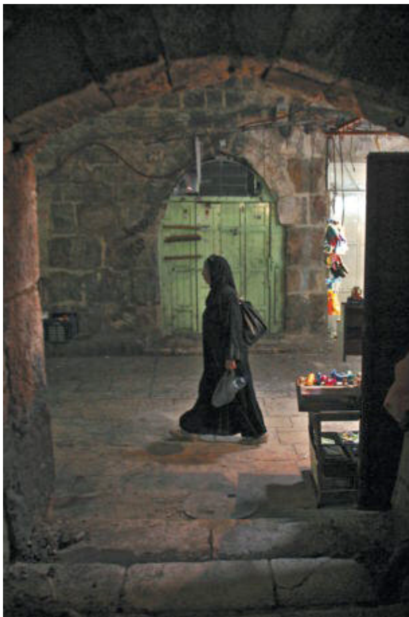
Imagen tomada en Jerusalén en octubre de 2009.