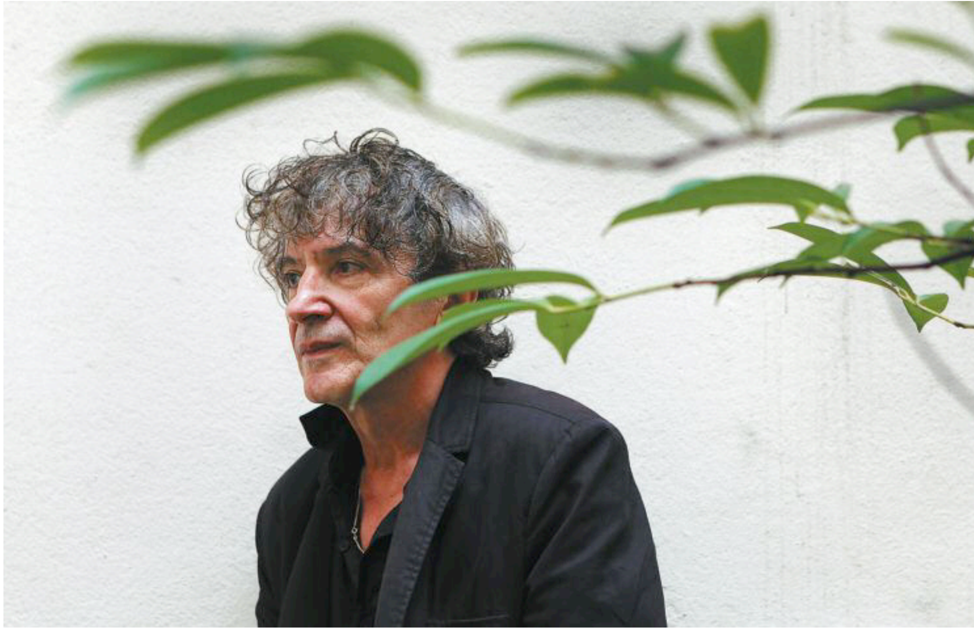
“Quería mostrar ese lado íntimo de todo gran drama, con todas sus contradicciones. Y sólo la novela puede explicar esa complejidad”, asegura Hubert Haddad, autor de Palestina .