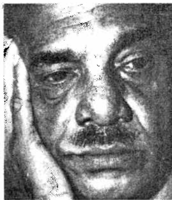
Vaikom Muhammad Basheer : du lyrisme sans faux pas.

LES HISTOIRES d'amour ne sont pas à la mode. Il faut avoir encore un pied dans la tradition orale, comme Vaikom Muhammad Basheer, pour s'aventurer sur le terrain glissant du lyrisme en sachant éviter les faux pas. Hommage à la femme et la flamme amoureuse, les nouvelles de cet Indien du Kerala n'ont pas seulement un charme désuet parce qu'elles ont été écrites entre les années 1940 et 1960. Ce baroudeur mystique, qui a connu autant de vies que Shiva compte de bras (il fut tour à tour mendiant, ascète hindou, puis soufi, magicien et astrologue, professeur d'anglais, propriétaire d'une échoppe de thé, journaliste militant et prisonnier politique et pharmacien ayurvédi-