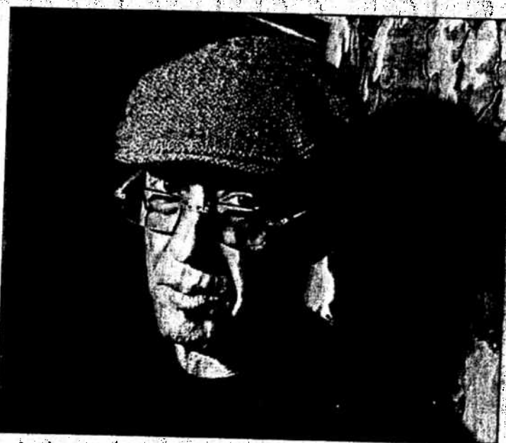
« Je ne garde rien pour moi. Je l'utilise dans mes livres... »

Dans Comment va la douleur, ou dans votre dernier livre La