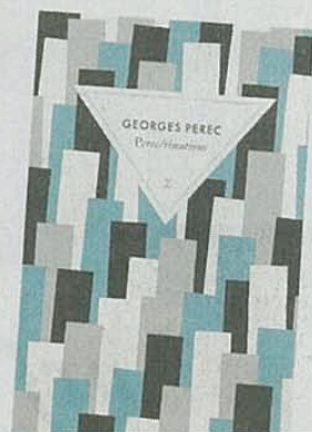
PEREC/RINATIONS De Georges Perec, Zulma, 140 p., 7,95 €.

Poussant encore plus loin le sens de l'humour et de l'insolite exprimé par Queneau dans Connaissez-vous Paris ? , Georges Perec nous avait laissé un délicieux opus ludique sur la capitale : Perec/rinations , composé et assemblé en 1980, deux ans avant sa disparition. Pour chaque arrondissement, l'auteur des Choses a créé une grille de mots croisés (64 cases), complétée, selon son loisir, par des anagrammes, des devinettes (sur les demeures d'écrivains, sur la quarantaine de rues parisiennes portant le nom de personnalités prénommées Pierre...), des calembours, des exercices pédestres pour Oulipiens (comment aller de Faidherbe-Chaligny au cours de Vincennes en empruntant six rues dont les noms commencent tous par la même lettre...). Le tout arrosé de citations rares, de records insolites et porté par ce goût si singulier pour la fantaisie érudite. Perec/rinations ou comment arpenter Paris en souriant. T. C.