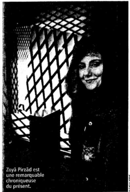
Zoyâ Pirzâd est une remarquable chroniqueuse du présent.